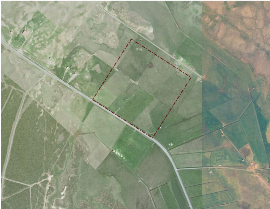
Mynd 1. Deiliskipulagssvæðið og skráðar fornminjar innan jarðarinnar Hnjúka við Blönduós.

Deiliskipulag þetta nær yfir um 15 ha svæði sem skilgreint er sem athafna- og iðnaðarsvæði, Hnjúkar (A1/I2) í aðalskipulagi Blönduósbæjar 2010-2030. Svínvetningabraut liggur sunnan við svæðið.